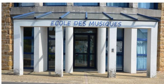
Loperhet Ecole des Musiques Place Saint Yves

Nos activités sont réparties sur quatre communes partenaires mais toutes les disciplines ne sont pas enseignées sur tous les sites.