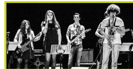
Groupes de Musiques Actuelles