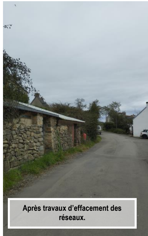
Après travaux d'effacement des réseaux.