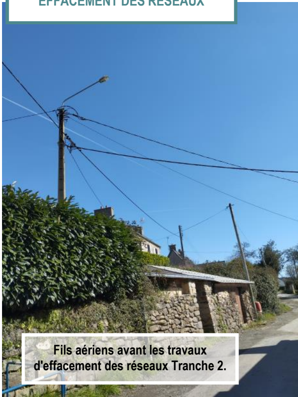
Fils aériens avant les travaux d'effacement des réseaux Tranche 2.