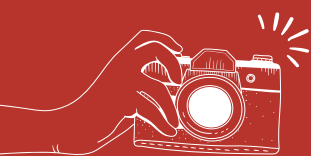
Photo du mois

Chantier de construction de la salle multifonctions