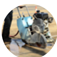
octobre Chantier de sol en régie Sciage /ouverture du sol