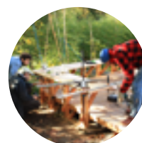
novembre Chantier participatif Constructions