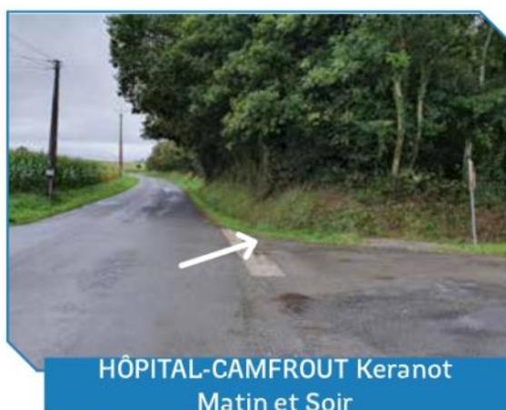
HÔPITAL-CAMFROUT Keranot Matin et Soir